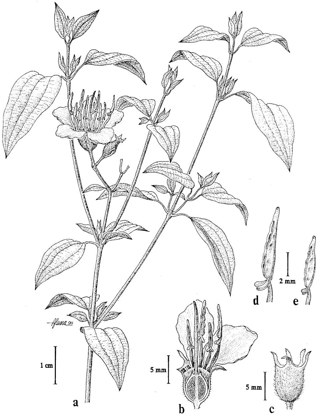
Fig. 2. Tibouchina scabriuscula . -A. Rama con inflorescencia. -B. Flor. -C. Sépalos sin seta terminal. -D. y -E. Estambres largo y corto con las prolongaciones del tejido conectivo.