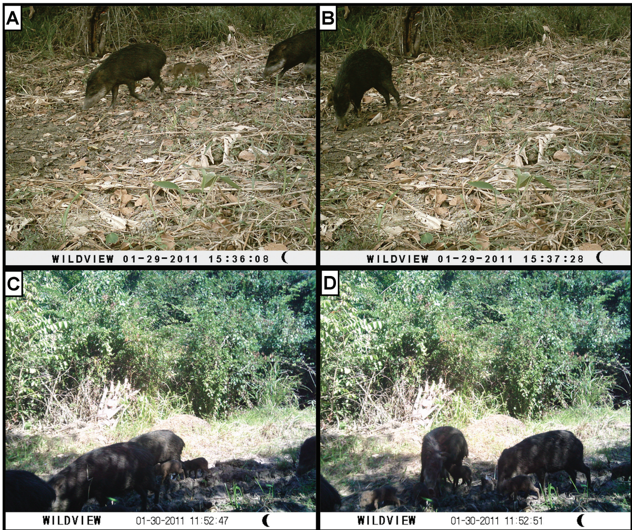
Figura 2. Registros fotográficos de pecarí de labios blancos en la región de la Laguna de Términos, Campeche, México. A, registro del 29 de enero de 2011 en el que se observan 2 adultos y 2 crías; B, registro del 29 de enero de 2011 en el que se observa un adulto; C, registro del 30 de enero donde se observan 4 adultos y 2 crías; D, registro del 30 de enero donde se observan 3 adultos y 6 crías.

conservación de especies en peligro de extinción. El que la mayor parte del área cubierta todavía por la vegetación natural conservada de la Selva la Montaña se encuentre fuera del APFFLT, indica que es urgente gestionar mecanismos de conservación que eviten la extinción local de esta especie por efecto de la acelerada pérdida de los bosques tropicales que rodean la laguna de Términos. (Mas et al., 2004; Soto-Galera, et al., 2010).