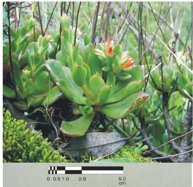
Figura 2. Echeveria purhepecha , hábito.