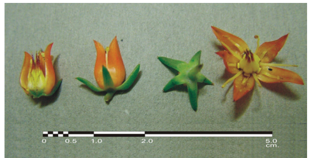
Figura 4. Segmentos del cáliz y de la corola de Echeveria purhepecha .