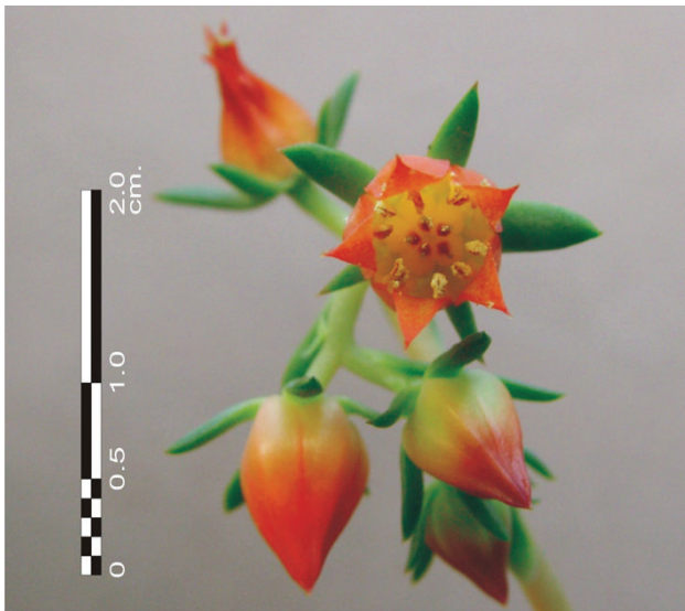
Figura 1. Inflorescencia de Echeveria purhepecha , que muestra el tamaño variable de los segmentos del cáliz, y la disposición de la corola, estambres y estilos.

Walther, E. 1972. Echeveria . California Academy of Sciences, San Francisco. p.175-197.