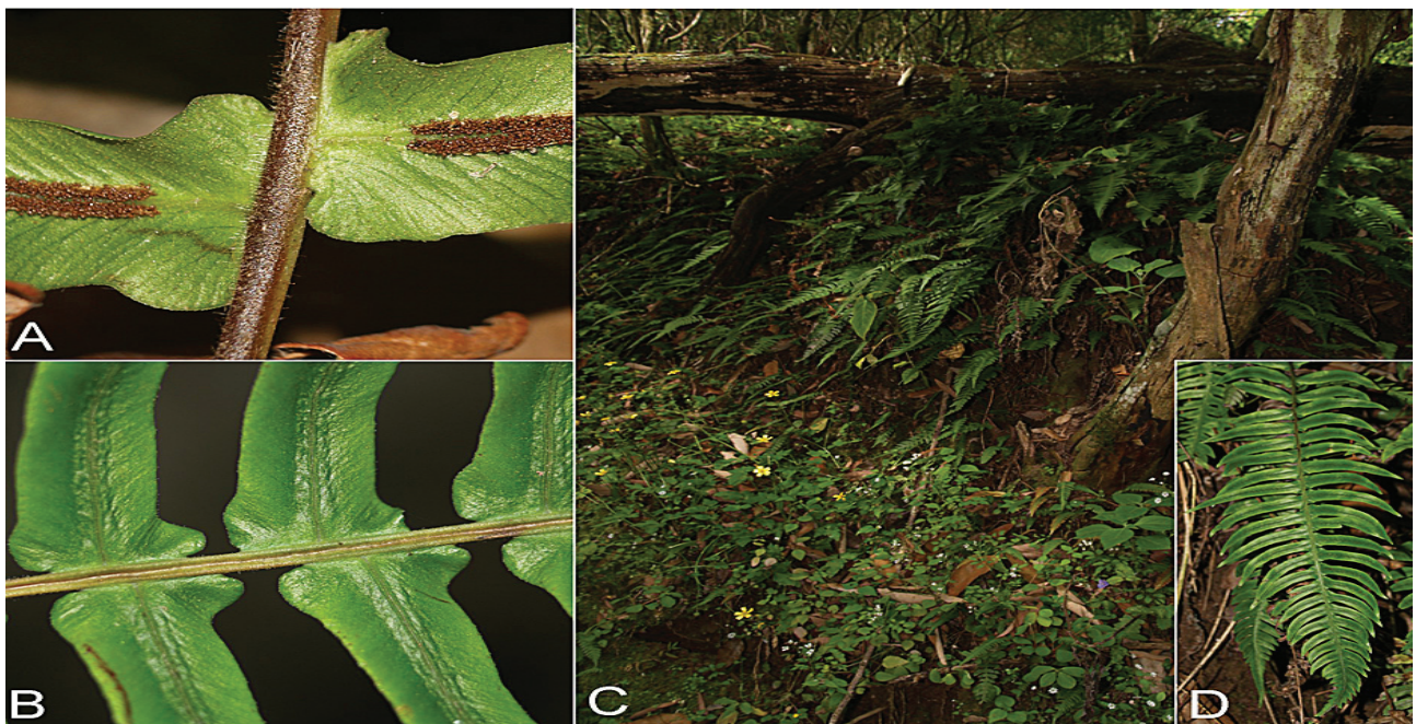
Figura 2. A, vista abaxial de las pinnas basales donde se aprecia la vellosidad característica de la especie; B, vista adaxial de las pinnas basales y el raquis acanalado; C, vista del hábitat; D, vista general de la fronda de Blechnum appendiculatum .

Esta adición a la flora de Nuevo León es un ejemplo más de la importancia de mantener la exploración botánica en el estado y, desde el punto de vista de la conservación,