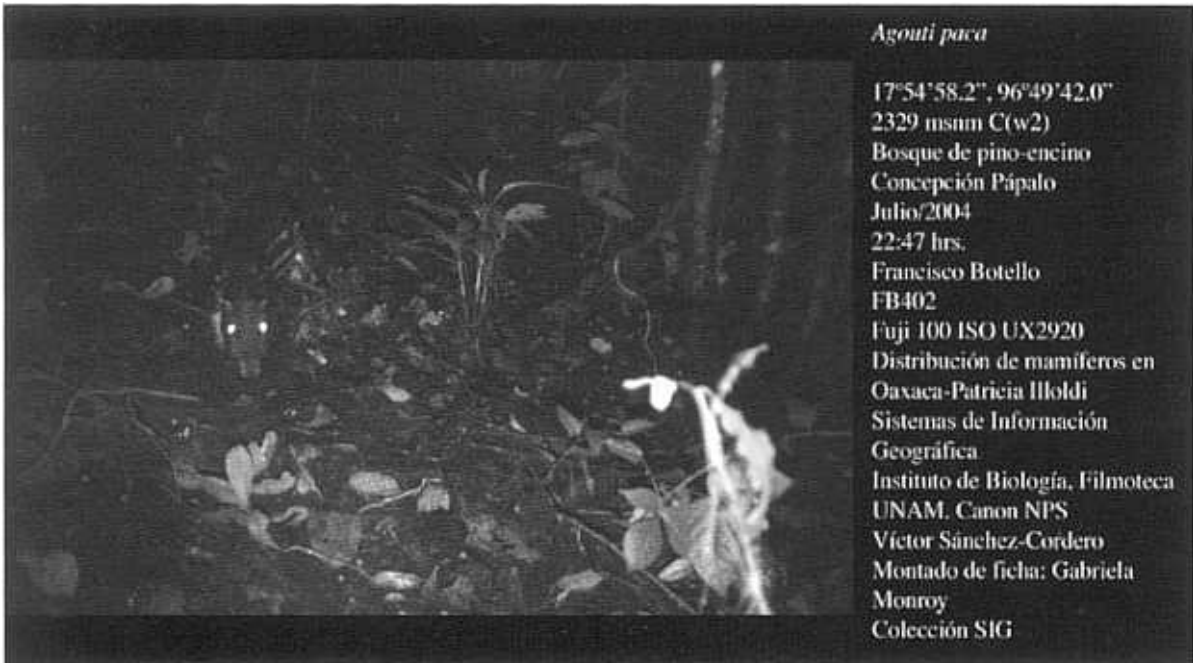
Figura 1. Registros fotográficos montados de Agouti paca para su inclusión en colección científica según Botello (2004). A. Fotografía tomada en vegetación riparia, rodeada de bosque tropical caducifolio. B. Fotografía tomada en bosque de pino-encino.