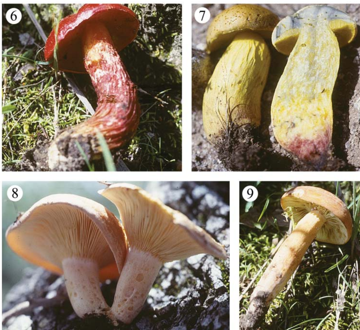
Figuras 6-9. 6. Boletus frostii (MEXU 23301). 7. Buchwaldoboletus hemichrysus (CESUES 37). 8. Lactarius chrysorheus (CESUES 105). 9. Lactarius volemus (CESUES 123).