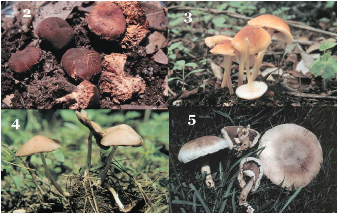
Figuras 2-5. 2, Setchelliogaster rheophyllus ; 3, Gymnopus confluens ; 4, Agrocybe pediades ; 5, Agaricus silvaticus