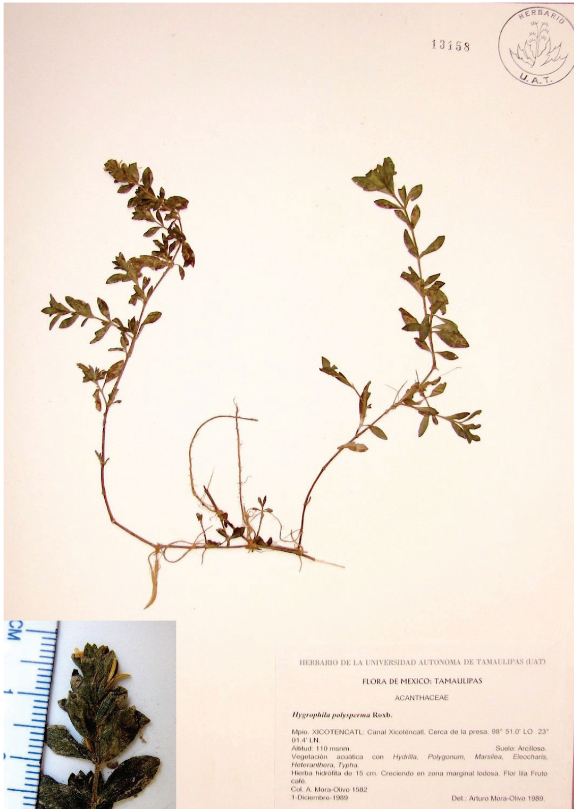
Figura 1. Ejemplar herborizado de Hygrophila polysperma colectado en Tamaulipas, México.