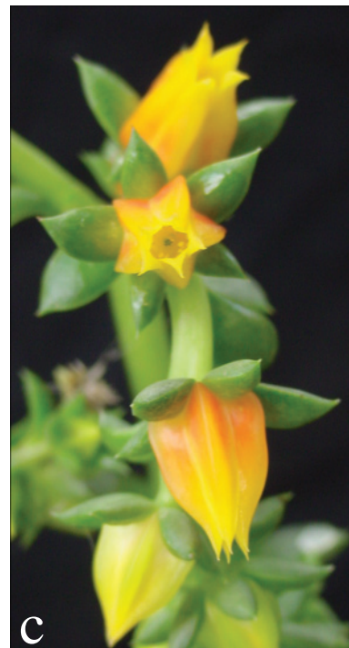
Figura 2. Echeveria tamaulipana J. G. Martínez-Ávalos, A. Mora-Olivo et. M. Terry. a, planta en su hábitat natural; b, inflorescencia; c, flor.

extendidas, de color verde oscuro brillante, en ocasiones con el margen rojizo; las más jóvenes acanaladas, de color verde claro brillante, con el margen de color más claro, de 1.9 a 2.5 cm de largo y 0.8 a 1.2 cm de ancho en la parte media. Pedúnculo curvo, de 37 a 42 (- 50) cm de largo, de 0.4 a 0.8 cm de grosor en la base, cilíndrico, de color verde claro; brácteas 25 a 31, ascendentes, alternas, las inferiores de mayor tamaño que las superiores, dispuestas en un ángulo de 35°, de 4.0 a 7.0 cm de largo por 0.9 a 1.2 cm de ancho y de 0.1 a 0.3 cm de grosor, lanceoladas; las superiores de 2.0 a 2.5 cm de largo, 0.5 a 0.7 cm de ancho y 0.2 a 0.3 cm de grosor, de forma obovada, algo achatadas de color verde pálido. Inflorescencia 1, con 1 a 3 ramas secundifloras, de 9.5 a 11 cm de longitud cada uno, de color verde claro. Flores 9 a 12 por rama; pedicelos de 0.2 cm a 0.4 cm de longitud y 0.1 a 0.12 cm de grosor; cáliz con