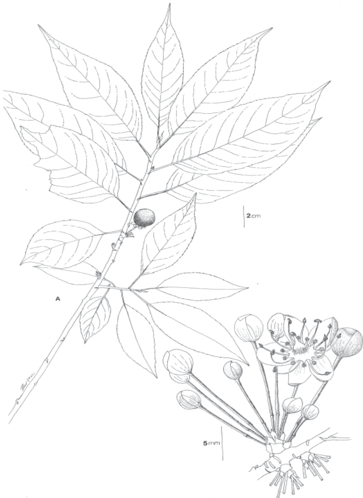
Figura 1. Casearia sanchezii sp. nov. A) Rama con frutos. B) Inflorescencia, mostrando una flor abierta. A tomado de Linares et al. 6035 y B tomado de Linares et al. 4499, ambos en MEXU.