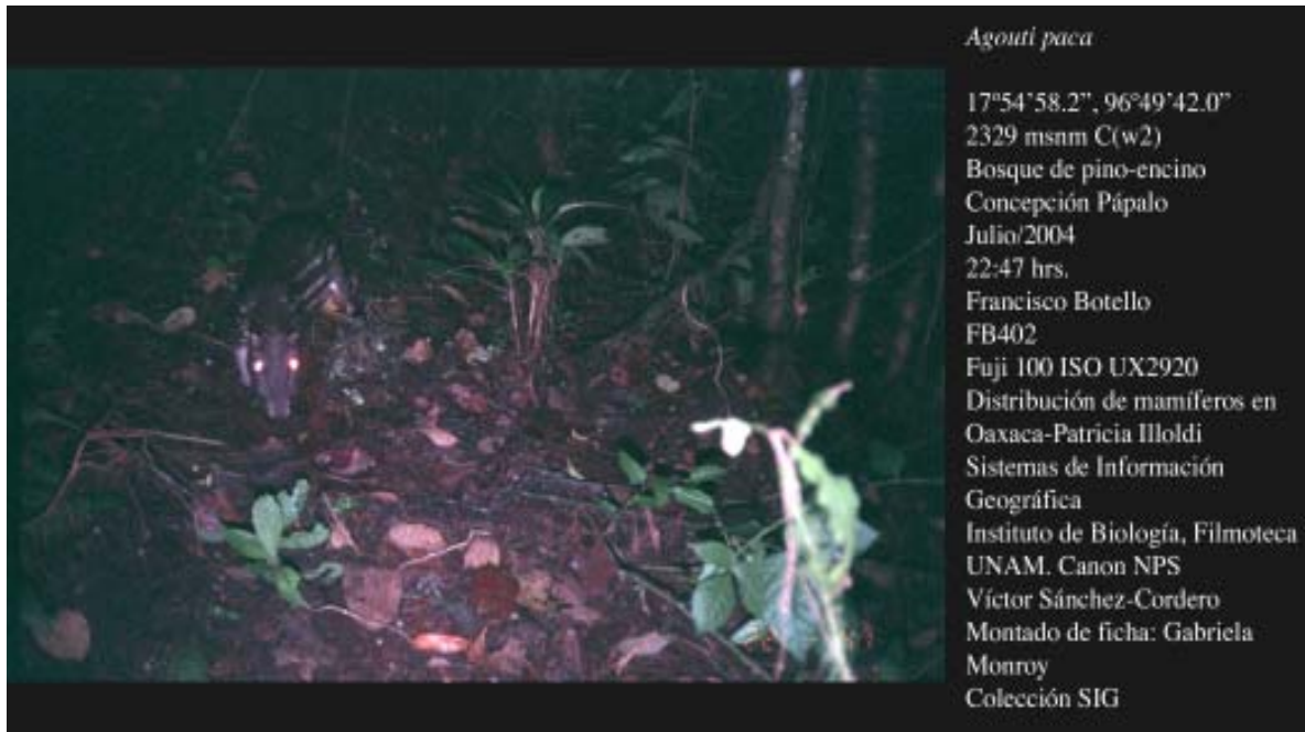
Figura 1. Registros fotográficos montados de Agouti paca para su inclusión en colección científica según Botello (2004). A. Fotografía tomada en vegetación riparia, rodeada de bosque tropical caducifolio. B. Fotografía tomada en bosque de pino-encino.