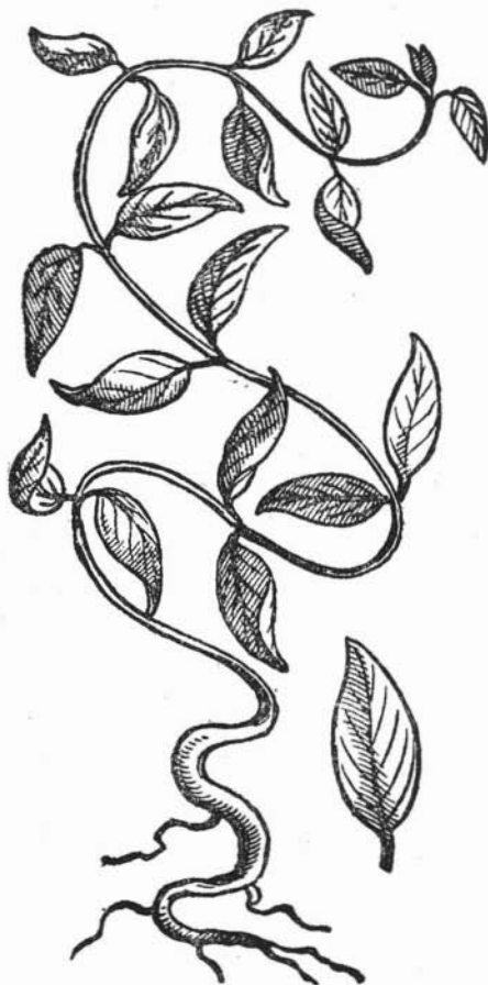
Fig. 137. QUAUHCHICHICPATLI Desmodium sp.

Es el QUAUHCHICHICPATLI una planta voluble con hojas como de limonero, pero más anchas y suaves, y tallos ci-