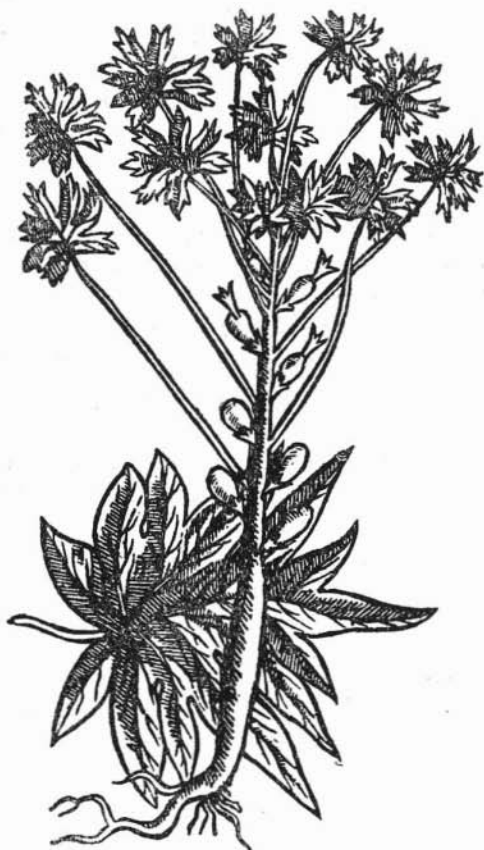
Fig. 133. CHICHIOALXOCHITL Carica papaya L.

usualmente dioicas, axilares, de olor fragante, solitarias o en cimas de 2 ó 3 flores; fruto oblongo u ovoide, de 5 a 10 cm. de largo o más grande llegando a 30 ó 50 cm., amarillo o naranjado, semillas numerosas negras.