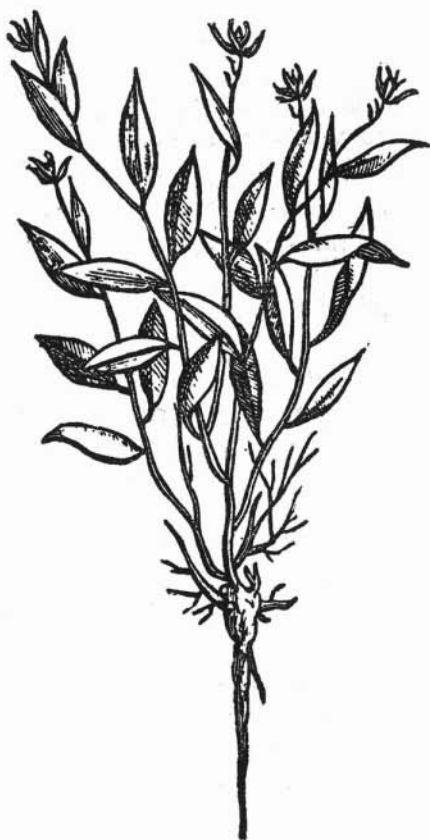
Fig. 138. COAPATLI Commelina sp.?

blanco. La raíz huele a almizcle, es amarga, glutinosa y acre, y de naturaleza caliente y seca en cuarto grado casi, por lo que quita los fríos de las fiebres y la flatulencia, suelda los