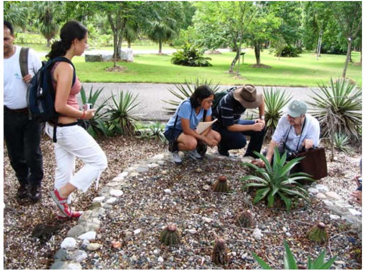
Algunos de los estudiantes y profesores participantes en el curso de cactáceas ofrecido por la SLCCS en la Universidad Autónoma y el Jardín Botánico de Santo Domingo, República Dominicana.

ción de una página Web de la Sociedad, la ampliación de la representación regional a un mayor número de países y a más de un representante, en el caso de países extensos como México y Brasil, el apoyo a la publicación de catálogos y floras locales o regionales de cactáceas y otras suculentas, y finalmente, la búsqueda de apoyo para el desarrollo de investigaciones sobre conservación y manejo de especies promisorias y bajo algún tipo de amenaza.