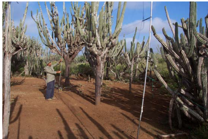
Sistema de captura de aves empleando mallas de neblina en un cardonal del Parque Nacional 'Cerro Saroche', Edo. Lara, Venezuela. (Foto: Jafet M. Nasar).

Estimar la importancia relativa de los cactus y agaves en la dieta de animales de zonas áridas va más allá de simplemente identificar y cuantificar renglones alimentarios en el contenido estomacal y fecal de las especies bajo estudio. Muchas especies animales dependen indirectamente de estas plantas, ya que se alimentan de especies que a su vez consumen tejidos derivados de los cactus y agaves. Una forma de acceder a esta información es a través del uso de la técnica de análisis de isótopos estables. Esta consiste en determinar la composición isotópica de elementos que conforman los tejidos de los organismos, y comparar dicha composición con la registrada en las posibles fuentes de alimento empleadas por los animales bajo estudio. La dieta de una especie en particular se refleja en la composición isotópica de los elementos que conforman sus tejidos. Se puede inferir así la importancia relativa de los distintos renglones alimenticios empleados por un organismo, siempre y cuando los mismos puedan discriminarse en base a su composición isotópica. Entre los elementos más comúnmente empleados en este tipo de análisis está el carbono ( ^{13}\text{C}/^{12}\text{C} ), que permite discriminar el mecanismo fotosintético de las plantas consumidas, y el nitrógeno ( ^{15}\text{N}/^{14}\text{N} ), que permite inferir el nivel trófico en el cual se encuentra un animal. Las plantas con metabolismo CAM (metabolismo ácido de las crasuláceas), presente en cactus y agaves, muestran una