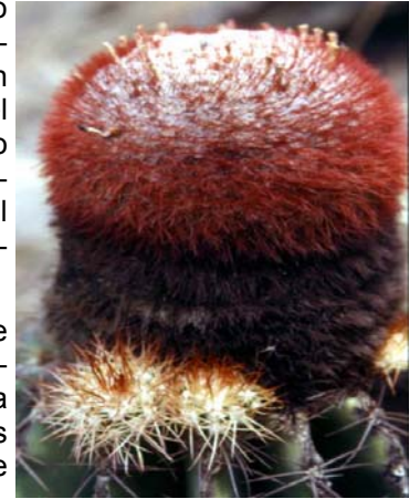
Melocactus hernandezii Fern. Alonso & Xhonneux (Fotos María A. Bello).

En el marco del proyecto Conservación y Uso Sostenible de Biodiversidad en los Andes Colombianos, el Instituto Humboldt ha venido desarrollando investigaciones en temas relativos al uso de los recursos silvestres.