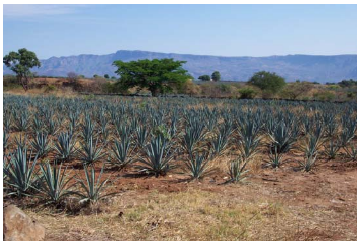
Siembra de agave azul ( Agave tequilana ) en Tequila, Jalisco, México.

Hasta la fecha se han descrito cerca de 200 especies de agave, en su gran mayoría por botánicos extranjeros. Sólo 10 especies han sido descubiertas y descritas por los botánicos connacionales, lo que realmente es de llamar la atención, si tomamos en cuenta que el 75% de las especies del mundo se distribuyen en México.